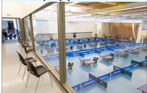
Salle spécifique La Millaire

10 place de la république - 57100 Thionville - ☎ +33 (0)3 82 82 80 80