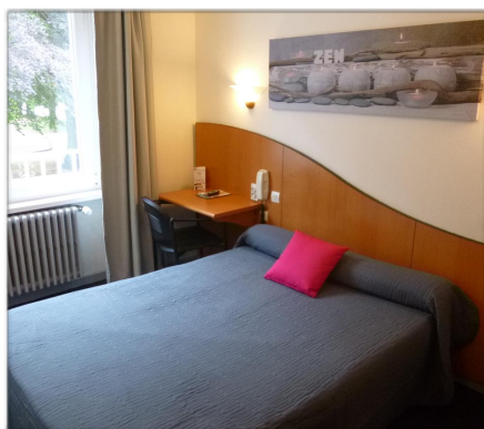
Chambre de l'hôtel du parc